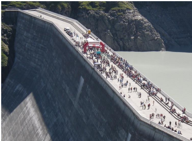
Arrivée sur le barrage de la Grande Dixence