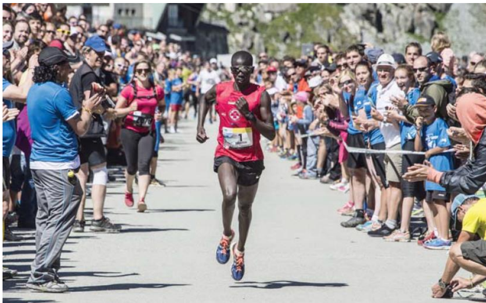
Isaac Kosgei (KEN) lors de sa dernière victoire en 2016